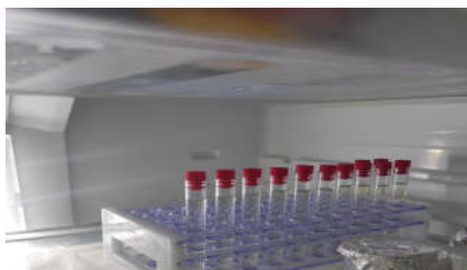
شکل ۱: ویال‌های پلیمر ژل MAGIC داخل یخچال

تصویربرداری ژل: سه روز پس از پرتودهی ژل‌های MAGIC، آنها توسط دستگاه تصویربرداری MRI با قدرت ۱/۵ تسلا اسکن شدند. به‌منظور برقراری ثبات دمایی، ژل‌ها به‌مدت دو ساعت در اتاق تصویربرداری قرار داده شدند. در این تحقیق، از توالی اسپین اکو چندگانه به تعداد ۳۲ اکو و کوئل سر بکار رفته است. جهت ارزیابی ژل MAGIC پارامترهای اسکن به‌صورت زیر گزیده شده‌اند: میدان دید ۳۳۰×۵۴۶ mm، اندازه ماتریکس ۴۰۰×۴۰۰ mm 2 ، زمان اکو ۳۰ ms، زمان تکرار ۳۰۰۰ ms، ضخامت برش ۲ mm و سایز پیکسل ۱/۲×۱/۲ mm 2 . کل زمان تصویربرداری ۱۸ دقیقه به‌طول انجامید. پس از اتمام اسکن، تصاویر با فرمت dicom آماده شدند. برای به‌دست آوردن مقادیر نرخ آسایش اسپین-اسپین (R2) تصاویر و میانگین‌گیری سیگنال از نرم‌افزار MATLAB استفاده شده است. اندازه‌گیری‌های مربوط به دوزیمترها: به‌منظور جمع‌آوری داده‌ها از دوزیمترهای Diode E, Pin Point و Semiflex استفاده شد.