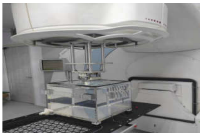
شکل ۲: فانتوم آب همگن

۱۶ g ژلاتین را به آن اضافه کرده و روی Magnetic stirrer قرار داده شدند و به‌مدت ۱۵ دقیقه محلول را رها کرده. در این مرحله محلول را روی بند ماری قرار داده و تا دمای ۵۰ °C به آن گرما داده شد و در همین دما نگه داشته شده جهت اطمینان از اینکه ژلاتین کاملاً حل شده باشد. در این مرحله ترکیب را از روی بند ماری برداشته و به محلول ۰/۴ gr Hydroquinone حل شده در ۹/۸ ml آب اضافه شد. زمانی که دمای محلول به ۳۷ °C رسید، ۰/۰۷۰۴ gr Ascorbic acid ترکیب شده با ۱۰ ml آب و ۰/۰۰۴ gr Copper sulfate محلول در ۶ ml آب و ۱۸ gr Methacrylic acid به داخل ظرف شیشه‌ای اضافه شد. در انتها، محلول را دوباره روی Magnetic stirrer قرار داده شد تا ترکیب کاملاً حل شده و شفاف گردد. پلیمر ژل که کاملاً همگون شده را داخل ۱۰ ویال پلاستیکی درب دار به ابعاد ۱۰×۱۰ cm ریخته و به‌مدت ۲۴ ساعت در یخچالی به دمای ۴ °C نگهداری شدند (شکل ۱).